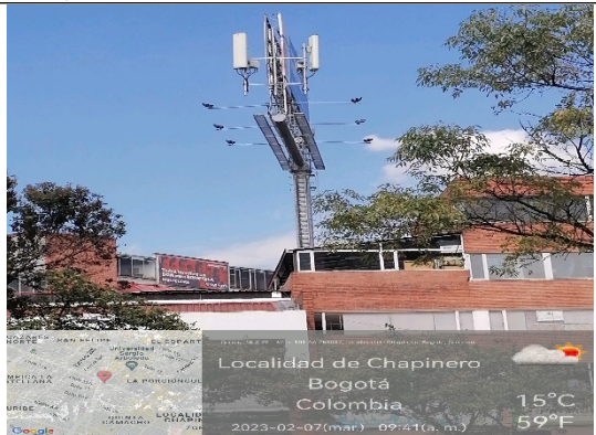
Foto 3. Vista del mástil en buenas condiciones y estable.