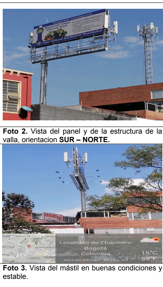
Foto 2. Vista del panel y de la estructura de la valla, orientación SUR – NORTE .